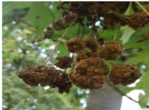
Le fruit du frêne malade

Malheureusement, la situation est exacerbée par le cumul des sécheresses de ces dernières années qui ont aussi affecté, lourdement l'autre essence principale de la forêt : le chêne. Les effets du changement climatique se font durement ressentir dans certaines parcelles, en particulier pour le chêne pédonculé. Le chêne sessile résiste mieux que le chêne pédonculé aux épisodes de sécheresse, ce qui justifie sa préférence dans les peuplements mélangés, car malgré tout, "le chêne" demeure une essence majeure de production.